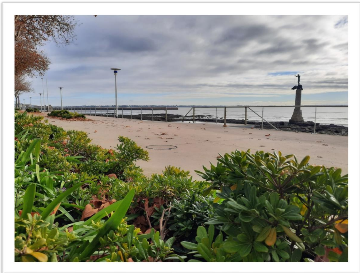
Le front de mer et son célèbre Sammy