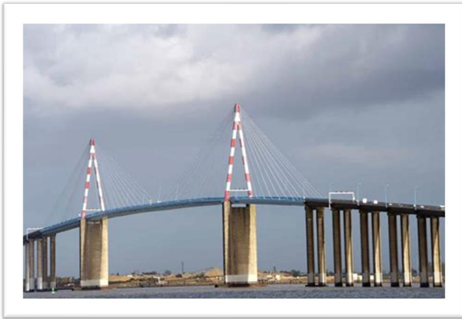
Le pont de Saint-Nazaire