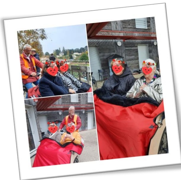
Première expérience grâce au prêt du triporteur par l'antenne de Nantes, le 16/11/2021. Vertou avec les personnes accompagnées par les Petits Frères des Pauvres