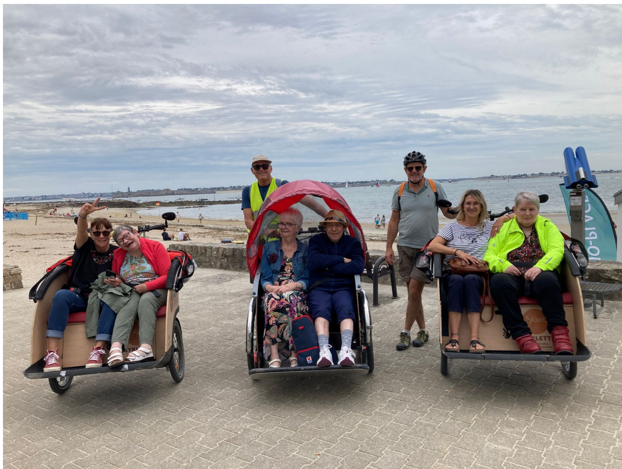
Balade pour les résidents de Ty Balafenn avec l'association Syklett de Lorient, ici sur la promenade à Larmor-Plage