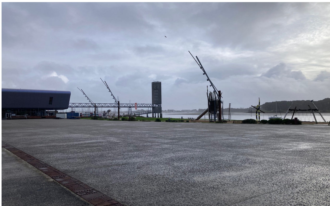
Pique-nique : Esplanade entre Gitana et la Cité de la voile